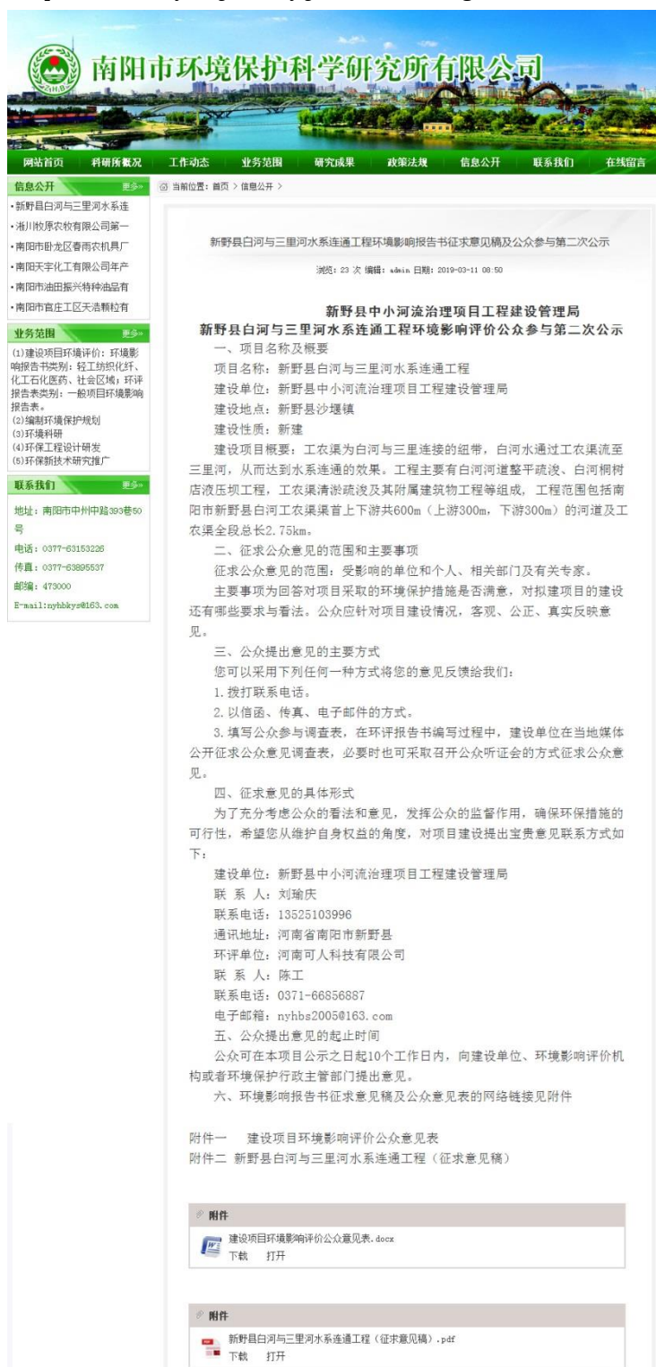
图2 第二次网络公示

网址: http://www.nyshjbhkyjs.com/a/xxgk/155.html 。