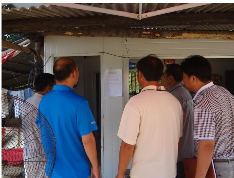
图 1 首次张贴公示