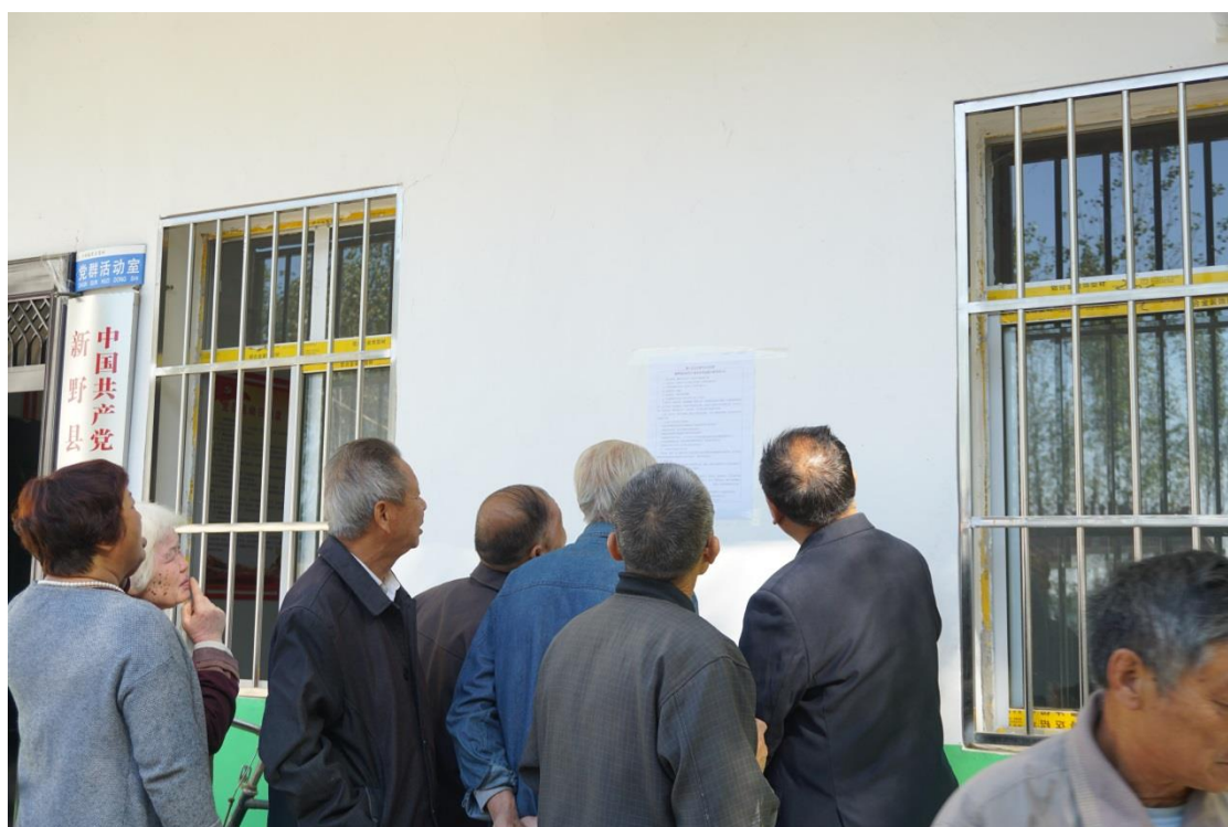
图 5 第二次张贴公示

本项目环境影响报告书征求意见稿完成时间为 2018 年 10 月下旬，当时《办法》尚未实施，建设单位根据《环境影响评价公众参与暂行办法》（环发 2006[28 号]）的规定，于 2018 年 10 月 25 日-2018 年 11 月 7 日（10 个工作日）进行了第二次公示，采取在厂址附近村庄张贴公告的形式，对项目环评基本信息、公众提出意见的方式及途径、报告书简本查阅地点等进行了公开，留证照片如下。