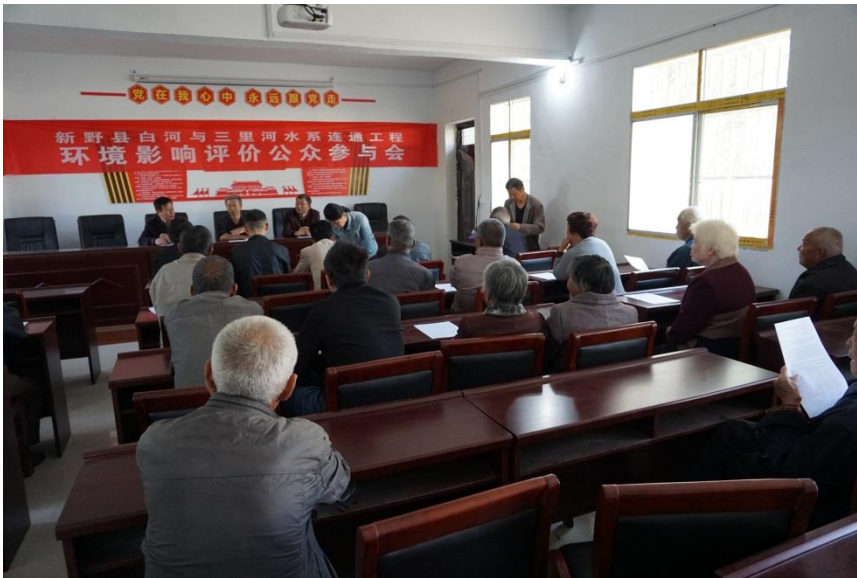
图6 公众参与座谈会

建设单位负责人主持会议并说明了召开本次座谈会的目的，环评单位编制主持人介绍了报告书主要内容以及征求意见的范围，针对与会人员提出的相关问题，建设单位和环评单位技术人员逐一进行了解释说明，并对公众代表提出的意见进行了记录。同时，建设单位向公众代表现场发放了公众参与调查问卷15份，并进行了现场填写和收集，经整理统计调查问卷，与会公众代表均表示支持项目建设，无反对意见。公众参与座谈会留证照片如下。